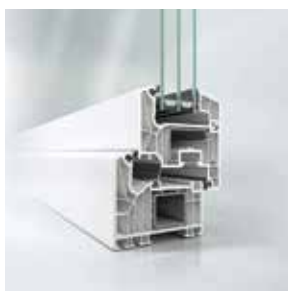
Profieldoorsnede Schüco LivIng Classic Coupe de principe Schüco LivIng Classic

Le système PVC Schüco LivIng est un système innovant à 7 chambres qui peut être fabriqué, grâce à la technologie du système Twin, avec ou sans joint central. Associé au joint central, le système atteint une adéquation aux maisons passives conformément à la directive ift Rosenheim. Mais aussi en tant que système avec joint de battement, d'excellentes qualités thermo-isolantes sont obtenues tout en proposant des masses de vue étroites.